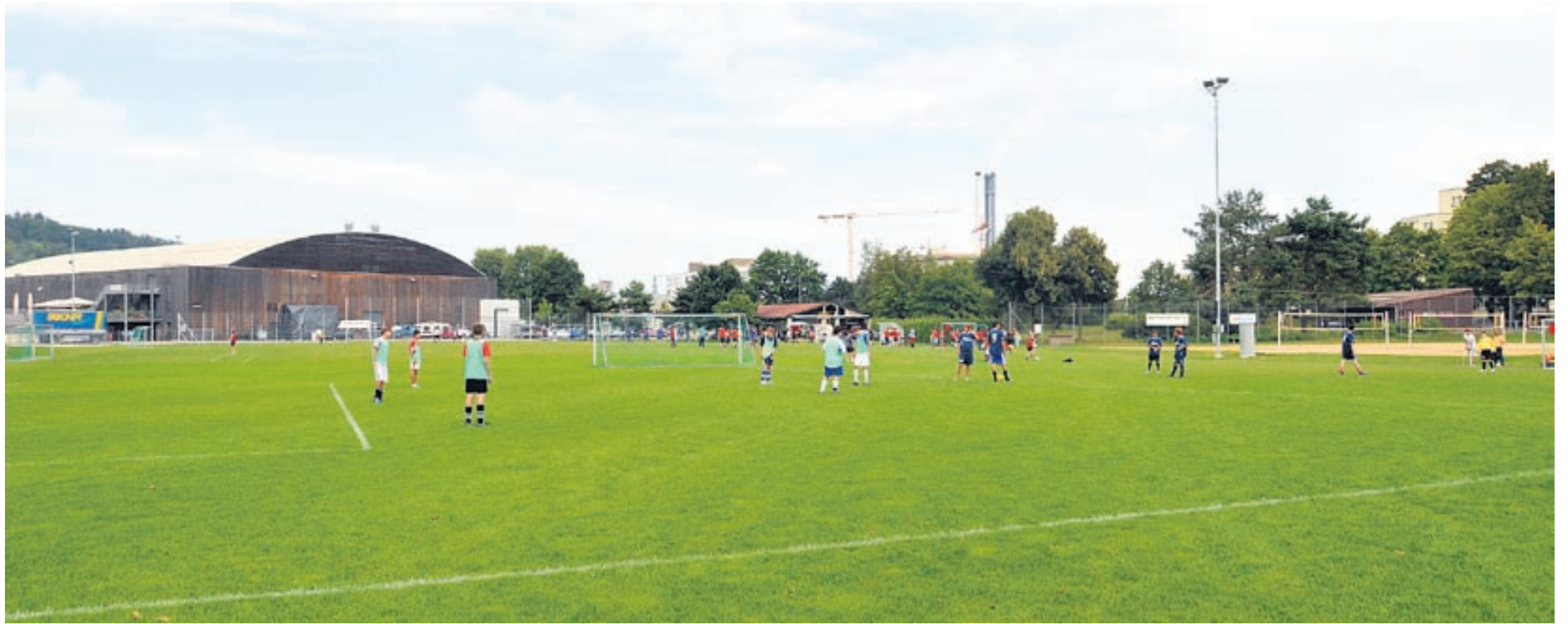
Sind die Planer erfolgreich, ist der Platz, auf dem die Jugendlichen gestern noch trainierten, ab Frühjahr 2013 Bestandteil des internationalen Zentrums für Leistungs- und Breitensport.